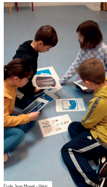
École Jean Monet - Héric