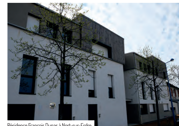
Résidence François Dupas à Nort-sur-Erdre