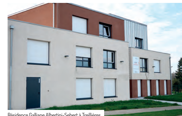
Résidence Galliane Albertini-Sebert à Treillières

2 résidences (40 logements) pour les jeunes actifs (salariés, stagiaires, apprentis, ...) ont été construites et livrées fin 2022 à Nort-sur-Erdre et Treillières